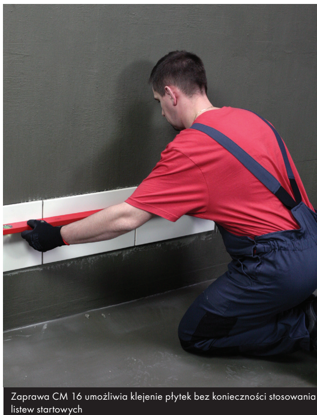
Zaprawa CM 16 umożliwia klejenie płytek bez konieczności stosowania listew startowych

Płytek nie moczyć w wodzie! Układać je na zaprawie i dociskać poki jeszcze zaprawa lepi się do rąk. Nie układać płytek na styk! Zachować szerokość spoin w zależności od wielkości płytek i warunków eksploatacji. Świeże zabrudzenia zaprawą zmywać wodą, a stwardniałe usuwać mechanicznie. Spoinować nie wcześniej niż po 24 godzinach używając spoin Ceresit z grupy CE.