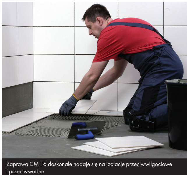
Zaprawa CM 16 doskonale nadaje się na izolację przeciwwilgociową i przeciwwodną

Zaprawę rozprowadzać po podłożu pacą zębatą. Wielkość zębów pacy zależy od wielkości płytek. Prawdłowo dobrana konsystencja i wielkość zębów pacy sprawiają, że docięnięta, typowa płytka ceramiczna nie spływa z płaszczyzny pionowej, a zaprawa pokrywa min. 65% powierzchni montażowej płytki. W przypadku zakurzenia, zabrudzenia spodniej części płytek, należy dokładnie oczyścić przed przystąpieniem do ich klejenia. Przy aplikacji CM 16 wewnątrz i na zewnątrz budynków – należy stosować metodę kombinowaną, tzn. poza rozprowadzeniem kleju po podłożu przy pomocy pacy zębatej, należy gładkim narzędziem nałożyć cienką warstwę zaprawy na powierzchni montażowej płytek.