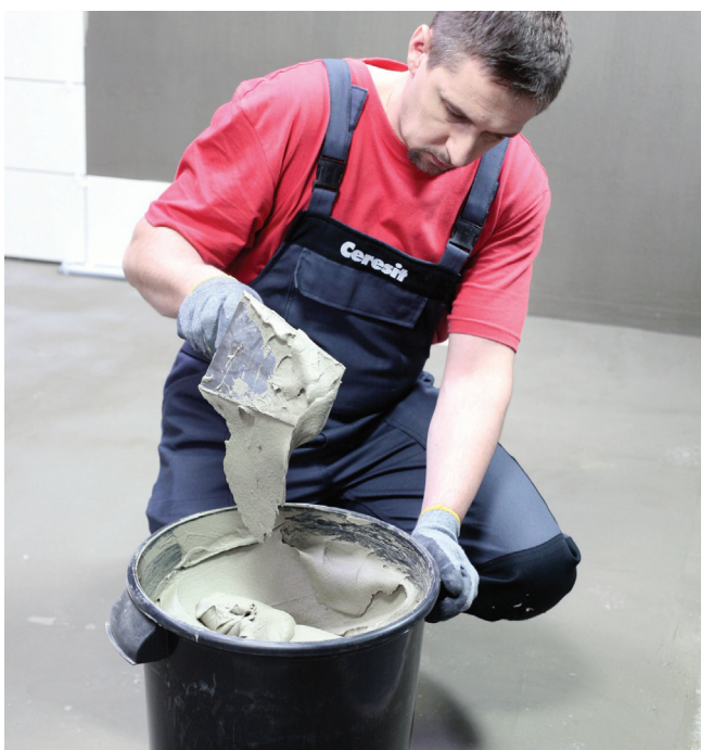
Zaprawa CM 16 w bardzo łatwy sposób rozrabia się i jest w 100% homogeniczna

Zawartość opakowania wsypywać do dokładnie odmierzonej ilości czystej, chłodnej wody i mieszać za pomocą wiertarki z mieszadłem, aż do uzyskania jednorodnej masy. Odczekać 5 min i jeszcze raz wymieszać. Jeśli potrzeba – dodać niewielką ilość wody i zamieszać ponownie.