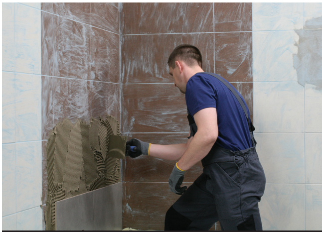
Doskonale nadaje się do klejenia płytek na istniejącej okładzinie ceramicznej

Istniejące zabrudzenia, warstwy zwierztałe i powłoki malarskie o niskiej wytrzymałości należy usunąć mechanicznie. Podłoża nasiąkliwe zagruntować preparatem Ceresit CT 17 i odczekać do wyschnięcia co najmniej 2 godziny. Nierówności podłoża do 5 mm mogą być dzień wcześniej wypełnione zaprawą CM 16. W przypadku większych nierówności i ubytków – na posadzkach należy zastosować materiały Ceresit z grupy CN, a na ścianach szpachlówkę Ceresit CT 29.